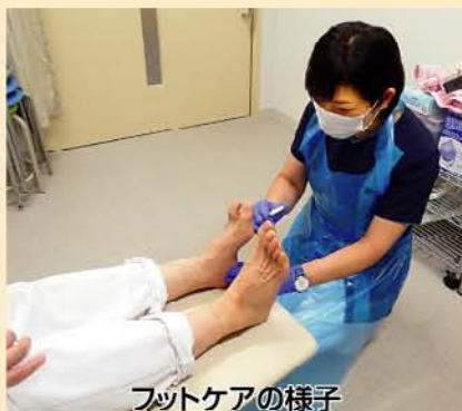
フットケアの様子

糖尿病の治療の目標は「健康な人と変わらないQOL(生活の質)の維持、健康な人と変わらない寿命の確保」です。糖尿病看護チームは日本糖尿病療養指導士、フットケア(重症化予防)などの資格や糖尿病の専門知識を持った看護師で構成されています。