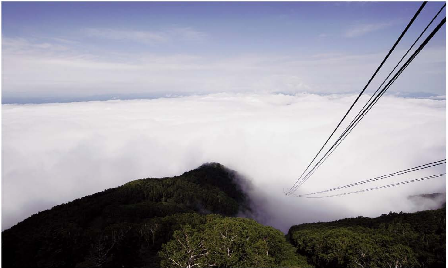
「雲海(竜王マウンテンパークにて)」