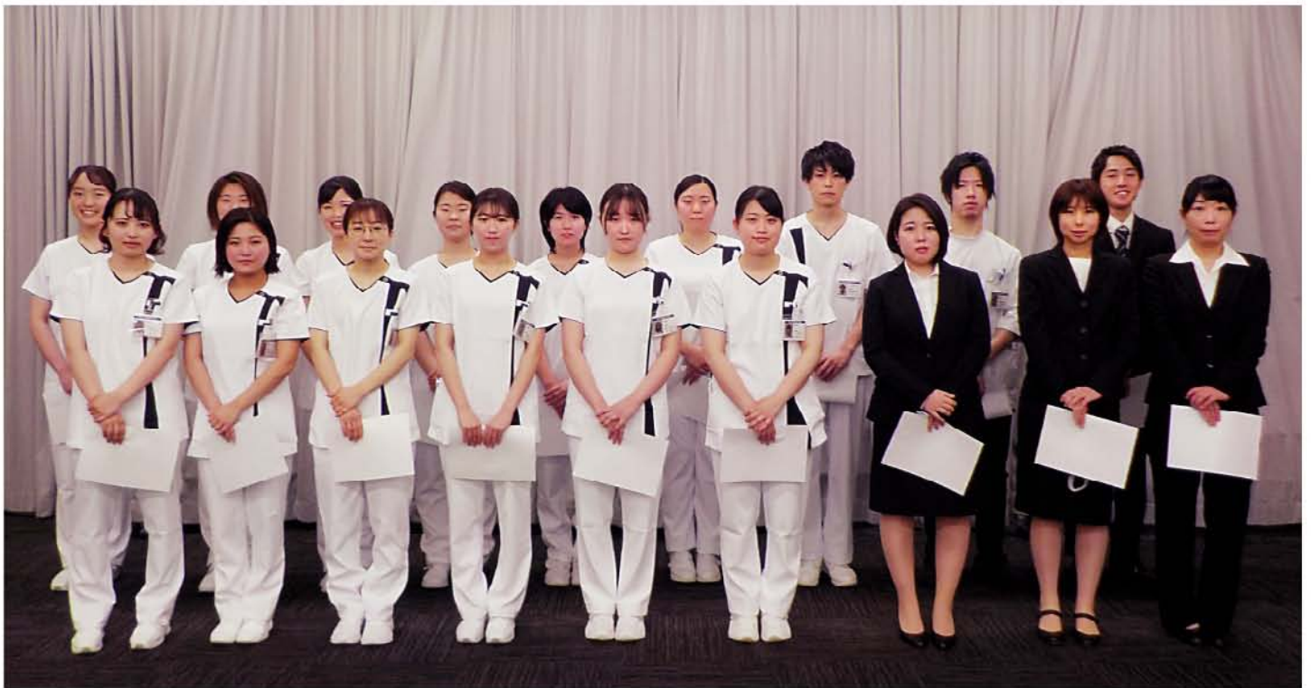
令和3年4月1日付で医師6名、研修医4名、看護師13名、薬剤師1名、診療放射線技師1名、理学療法士1名、管理栄養士2名、総勢28名の新規採用職員が仲間入りしました。皆様、よろしくお願ひします。