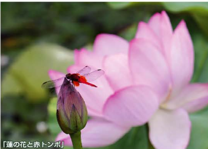
「蓮の花と赤トンボ」