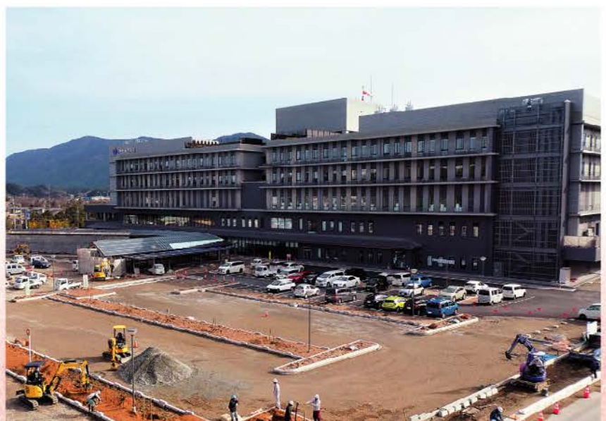
完成に向けて整備を進める駐車場と新病院

新病院という言葉もすでに古いものになってしまいました。いつまでも新病院ではありません。皆様からのご期待に十分お応えすることができるよう、今年も昨年にもましてより一層の努力をしております。伊勢在住の方はもちろん、周辺の市町の皆様も病気やけがでお困りの際は伊勢病院をご利用くださいますようお願いいたします。