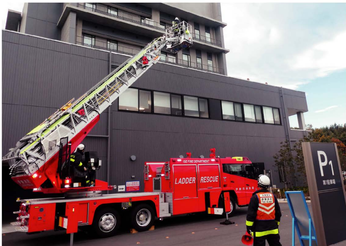
令和元年12月5日実施の総合防災訓練の様子(はしご車による救助活動)