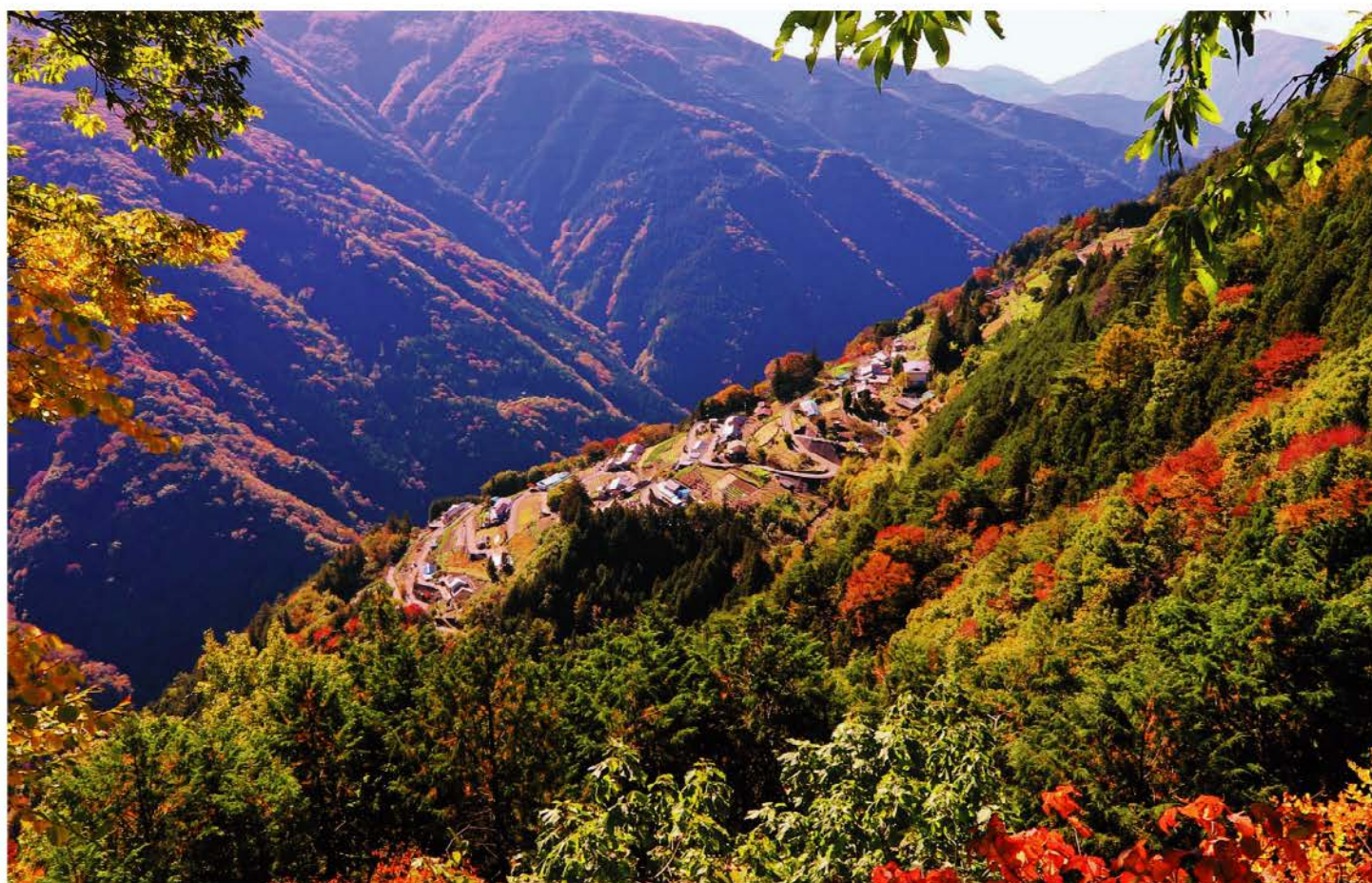
「下栗の里、しらびそ高原」