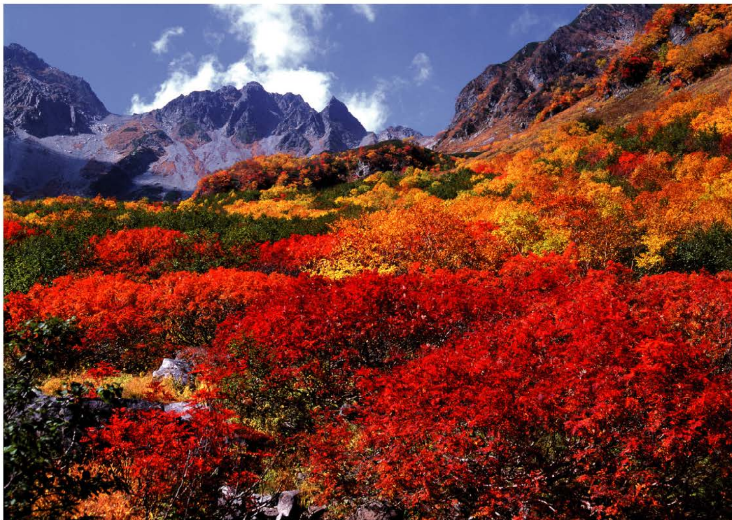
「秋の彩り(洞沢 10月初旬)」