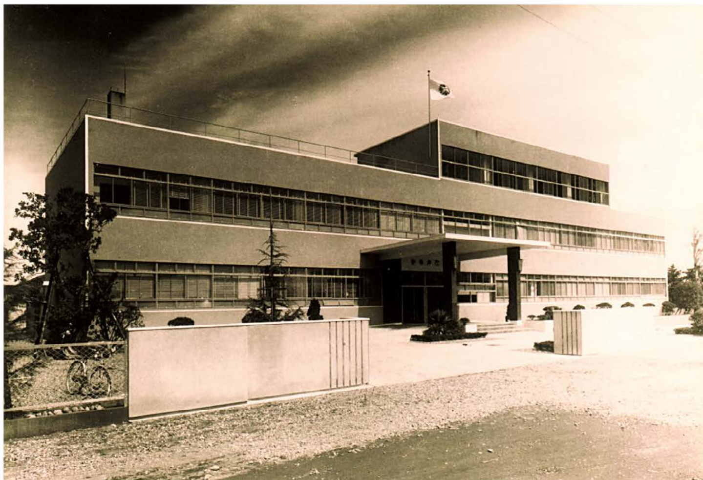
1957年(S32)河崎1丁目に新築移転した当時の「市立伊勢病院」。1979年(S54)までこの地で診療を行っておりました。