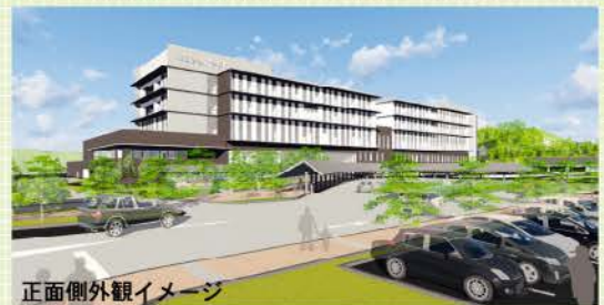
正面側外観イメージ

新病院の建設工事基本設計がまとまりました。新病院は、現在の病院の南側の敷地に、地上5階建てで、屋上には庭園やヘリポートも建設予定です。来院される方に癒しを与えられる快適な療養環境となるように、緑豊かな環境と地域医療を守る新しい病院を整備します。今後は、実施設計を進め、平成28年度の着工、平成30年の開院を目指してまいります。(新病院建設推進課)