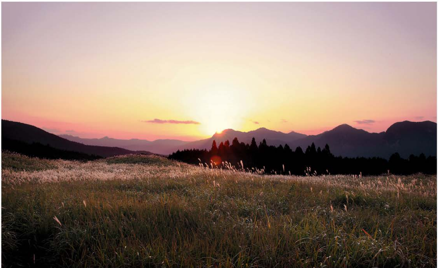
「曾爾高原」