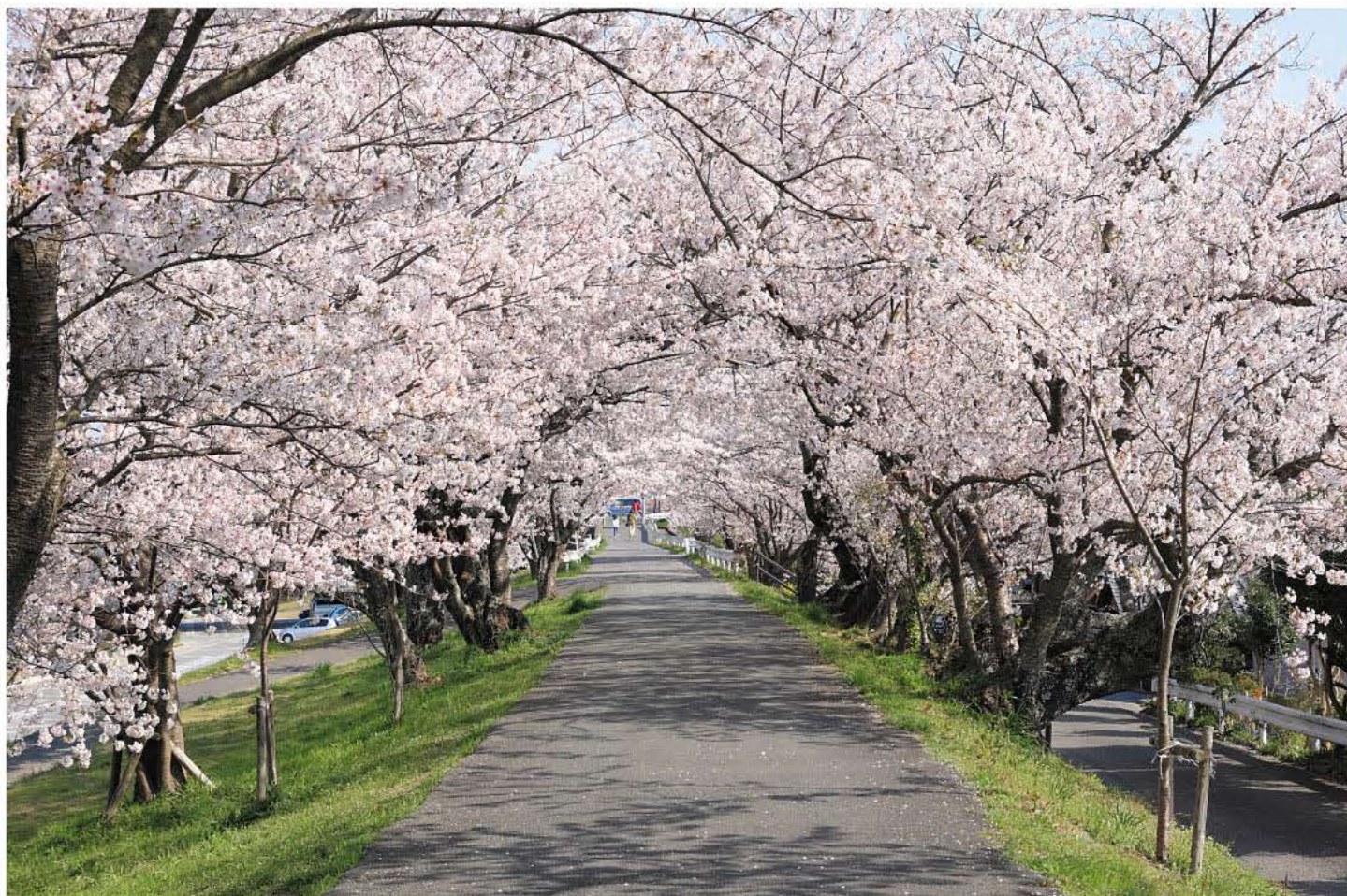
「桜のトンネル」