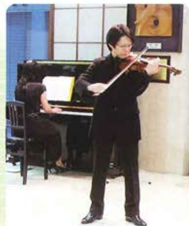
平成22年2月15日 病院ロビーにて

今後も、皆様の心の安らぎになるようにこのような機会を設けていきたいと思っております。