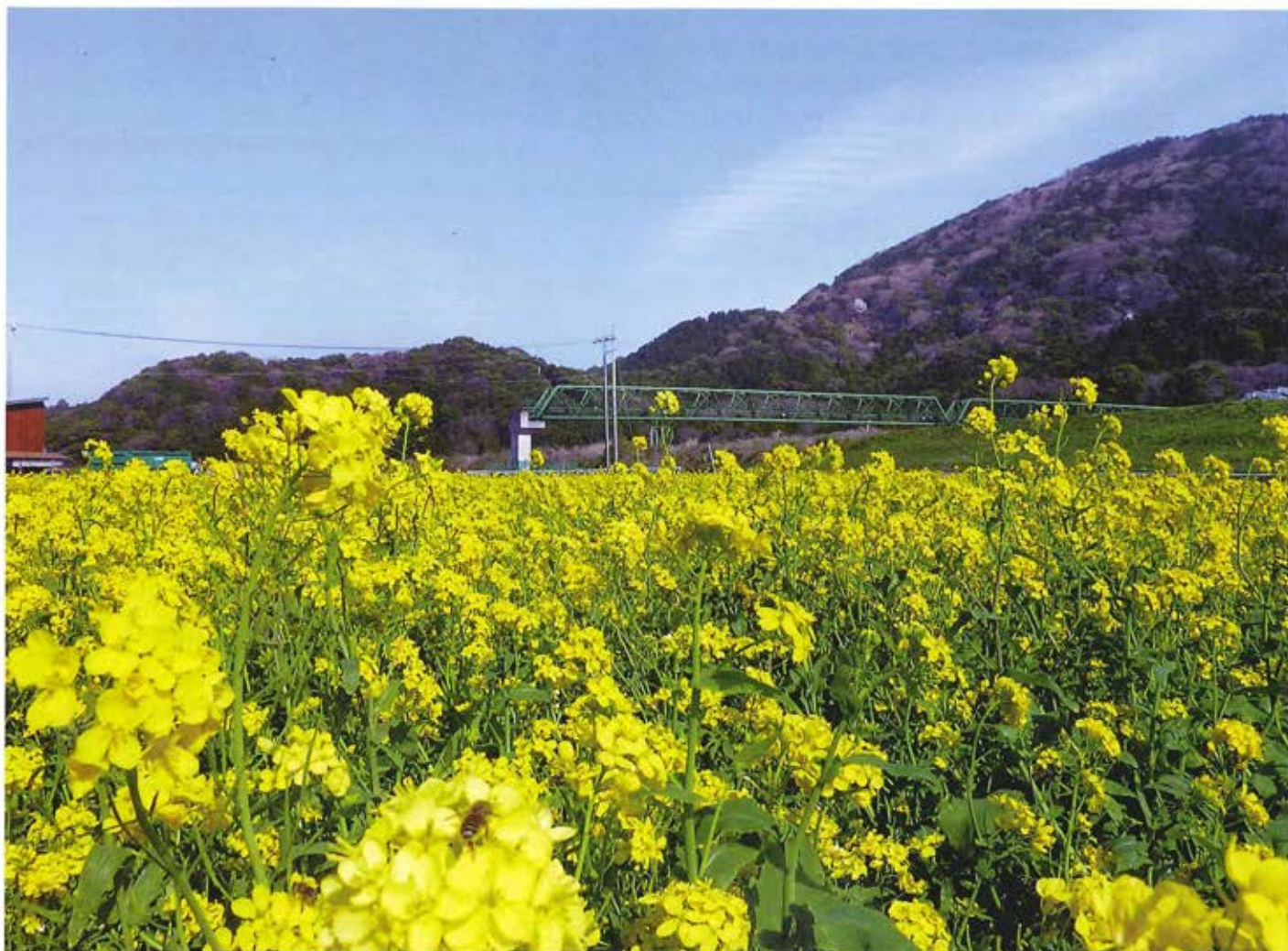
「菜の花と朝熊山」