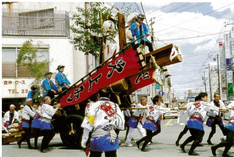
第62回式年遷宮「お木曳」