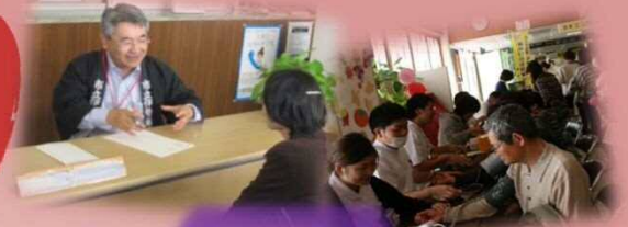
医療相談 健康チェック その他体験