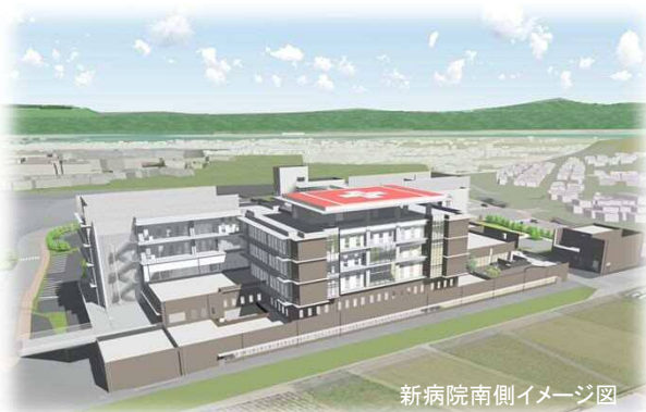
新病院南側イメージ図