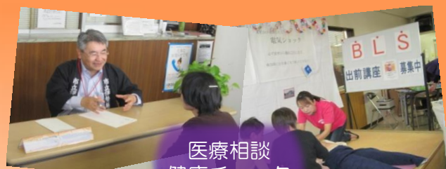
医療相談 健康チェック その他体験